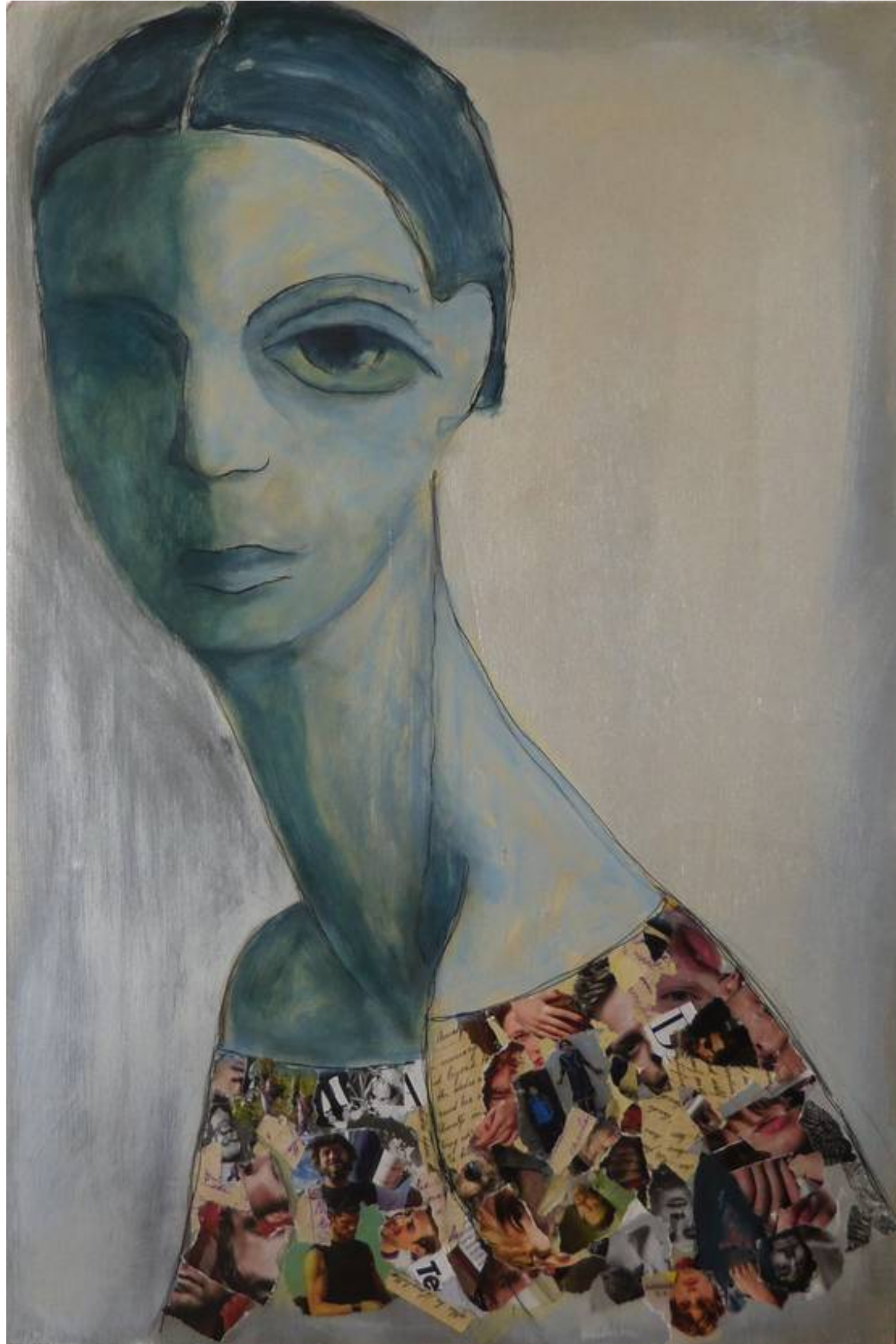
ST tecnica mista su tavola