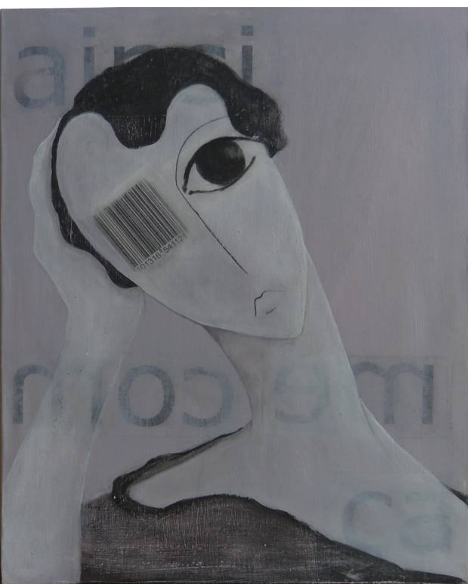
Ainsi comme ça (12)