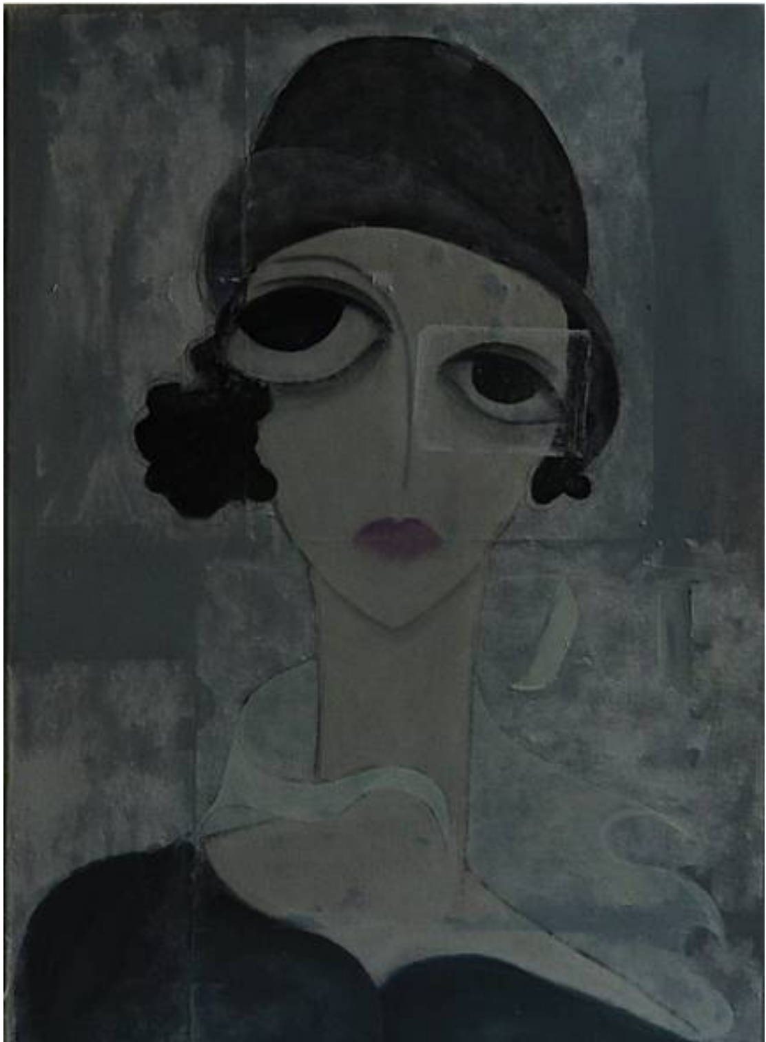
Elle (1) tecnica Mista su tela cm 40x60