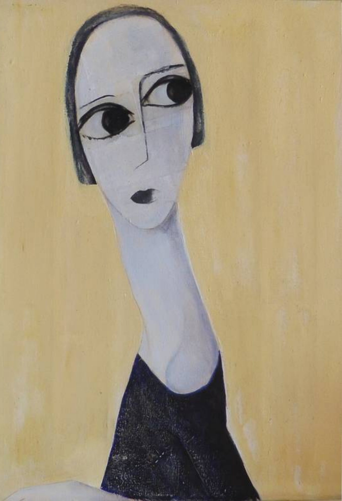
Ainsi comme ça 11 tecnica mista su tela cm 50x40